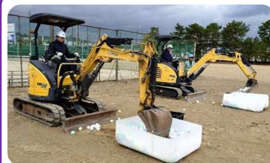
【 バックホウ操作 】