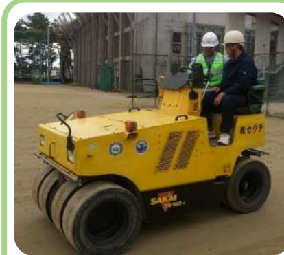
【 転圧管理 】