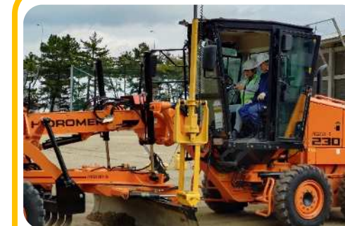
【 ノーマルグレーダー試乗 】

今回の実習は、初めての校内実施となり、グラウンドや実習棟等の裏など広範囲にわたって貴重な機会をご提供いただき大変勉強になりました。特に最新のモーターグレーダーをはじめとするICT建機を見学できたことは生徒たちにとってもおおきな刺激となったようです。普段の実習では体験できないアスファルト舗装実習に触れることができ、非常に有意義な時間となりました。どうもありがとうございました。