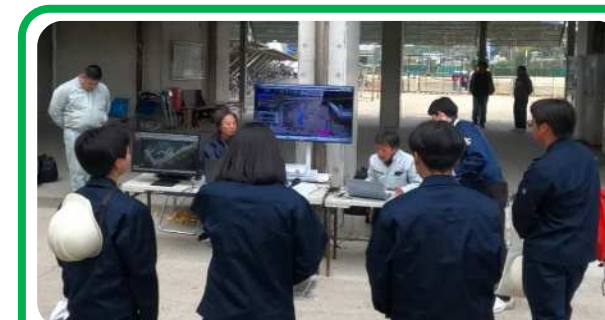
【 3Dスキャン測量 】